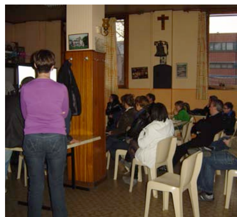
Les parents regardent la vidéo.

En signalant que je n'étais pas intervenue sur le fond, cela a ajouté un crédit supplémentaire à la véracité du documentaire.