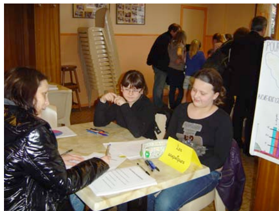
Une maman répond à des questions en observant un graphique réalisé par les élèves.