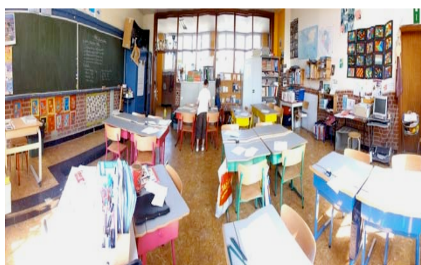
Une des dispositions de la classe.