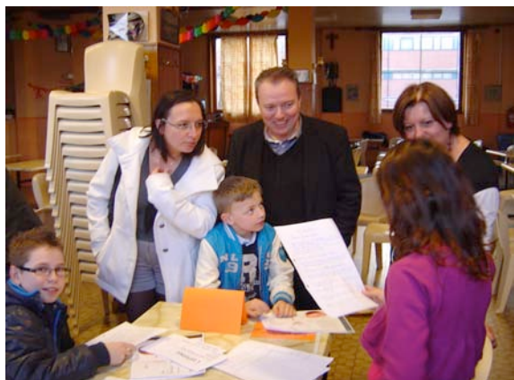
Une famille répond à des questions sur le système digestif.

Pour aider les parents à se mettre rapidement en action, je leur ai proposé de commencer par l'atelier de leur enfant. Ensuite, au signal, les familles se rendaient à l'activité suivante. Pendant ce temps de recherche, je passais dans les groupes pour récolter les impressions, les commentaires et rassurer les élèves impressionnés par les adultes. Il ne faut pas dépasser 7 minutes par activité, au risque de décourager les parents face à la quantité de mises en situation.