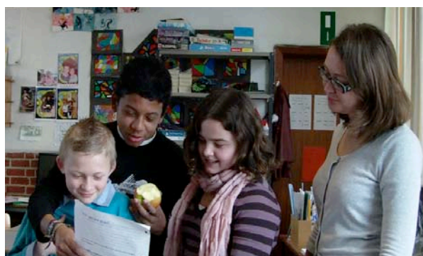
Un groupe d'élèves interroge l'institutrice qui les prend en charge le mardi.